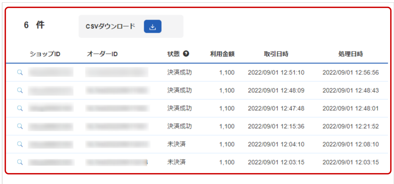
表 取引一覧表示項目