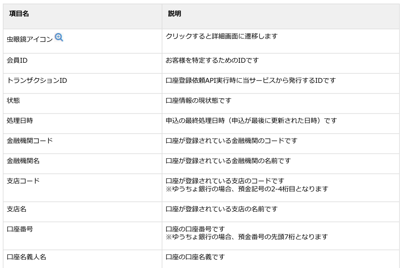
表 申込情報一覧表示項目