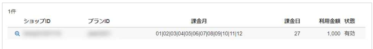
表 6.1-2 プラン一覧表示項目