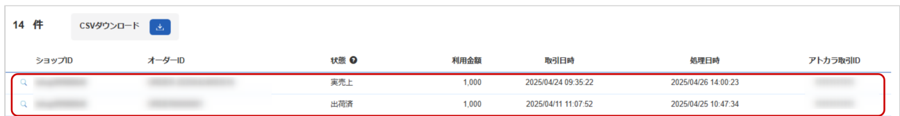
表 取引一覧表示項目