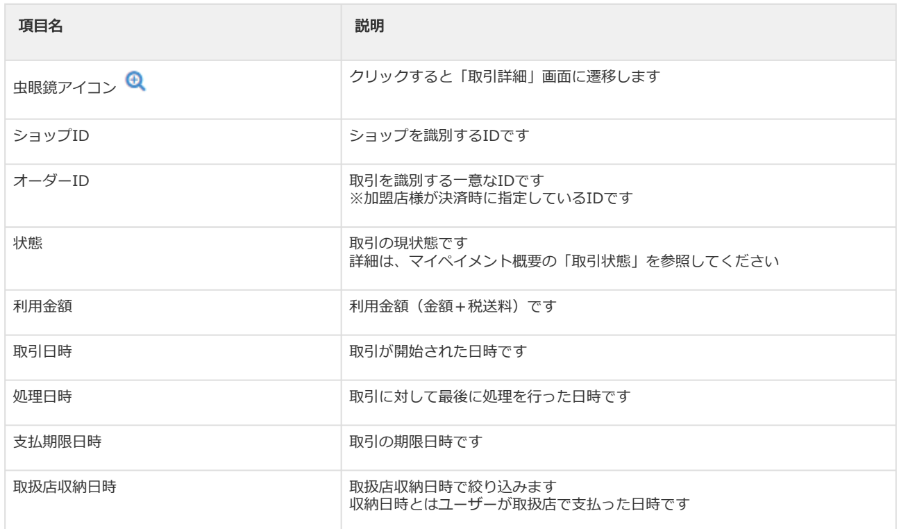
表 取引一覧表示項目