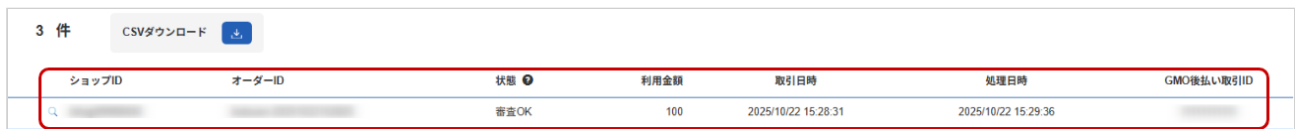
表 取引一覧表示項目