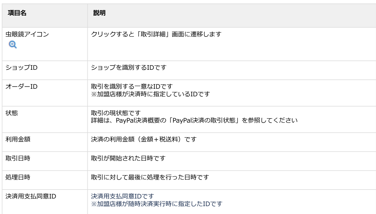
表 取引一覧表示項目