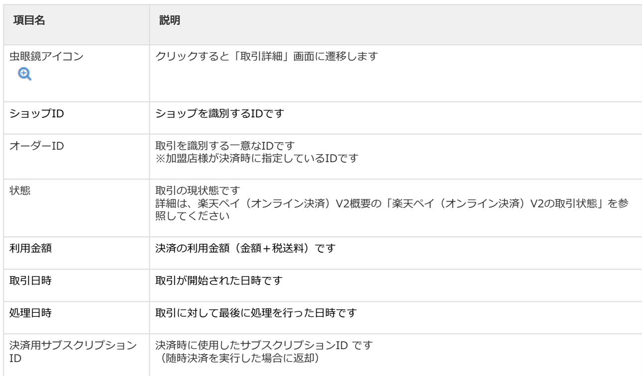
表 取引一覧表示項目