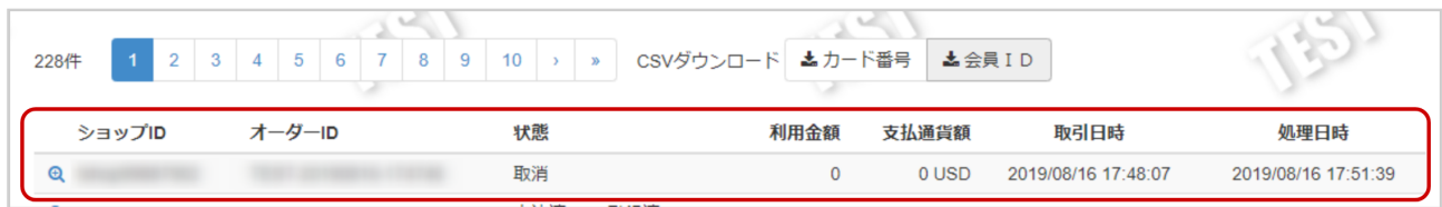
表 取引一覧表示項目