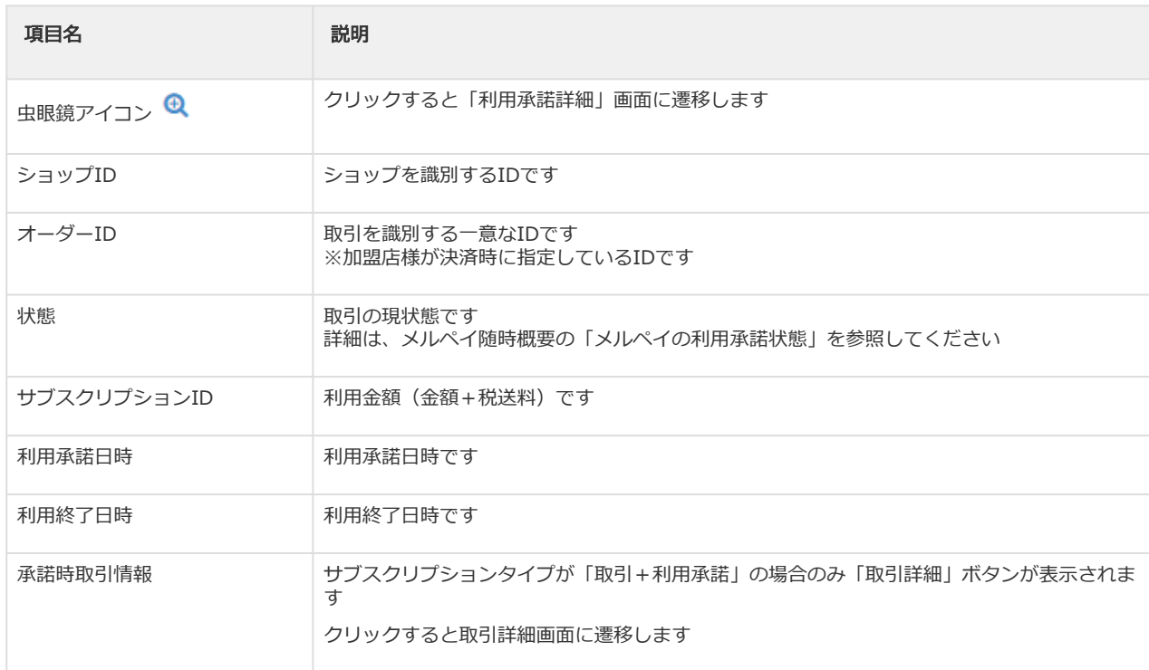
表 利用承諾一覧表示項目