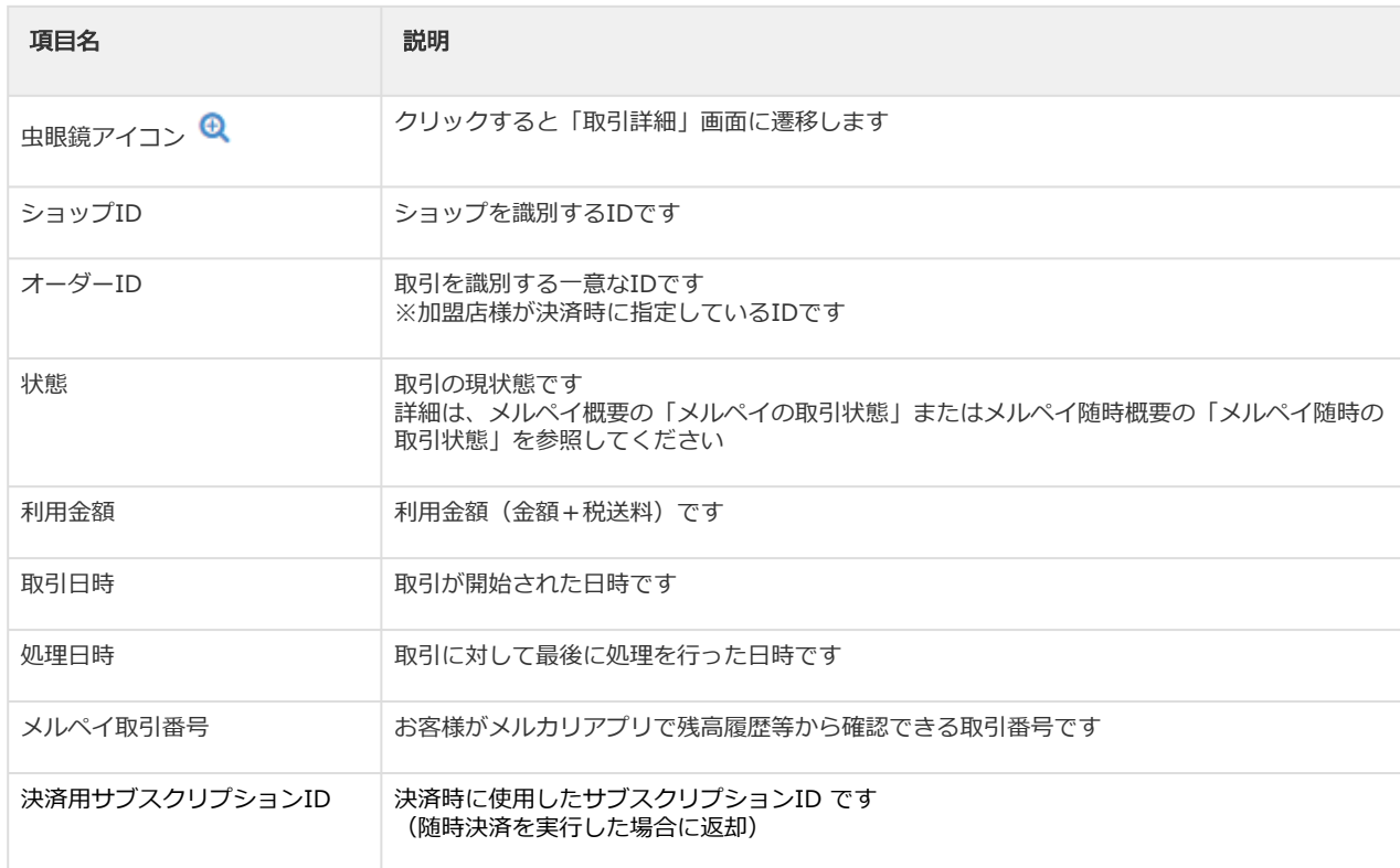
表 取引一覧表示項目